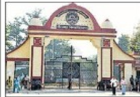
पाए, इसके लिए पुलिस अभ्यर्थियों की वैकिंग करेगी।

गोरखपुर में बनाए गए कुल 30 परीक्षा केंद्रों में से 10 परीक्षा केन्द्र डीडीयू कैम्पस में हैं। इनमें मुख्य परिसर में आठ और महाराणा प्रताप परिसर में दो केंद्र शामिल हैं। हर केंद्र पर एक सेक्टर मजिस्ट्रेट और दो पर्यवेक्षक नियुक्त किए गए हैं। कोई भी अभ्यर्थी मोबाइल या अन्य कोई भी सामग्री न ले जा